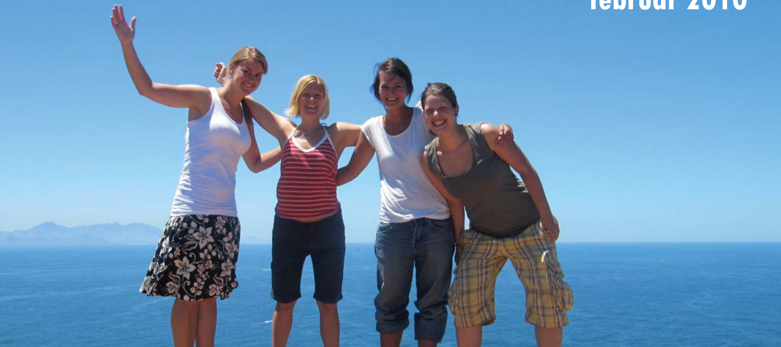
Over: Turister på Cape Point

Det er søndag, og vi er i Hatfield sentrum for å se fotballkamp med laget vårt, Mamelodi Sundowns, og rehydrere oss selv. Sesongen nærmer seg slutten, og det er spennende kamper som gjenstår. Forrige runde ble begge fotballkampene som ble spilt i Pretoria avlyst grunnet ekstremt regnvær. Vi har opplevd hagl på størrelse med klinkekuler, torden og lyn, og takk og lov basseng i hagen når varmen blir for heftig.