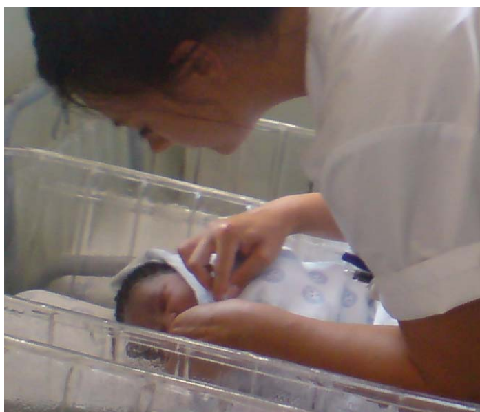
Over: Jordmorpraksis: sabla my barn her