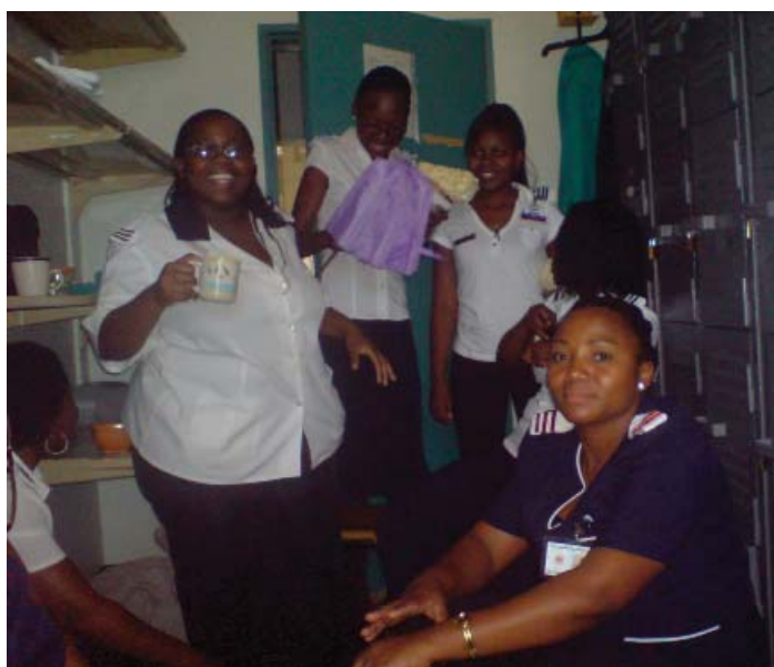
Over: Alltid god stemning med de andre studentene på linen room under tea-time.