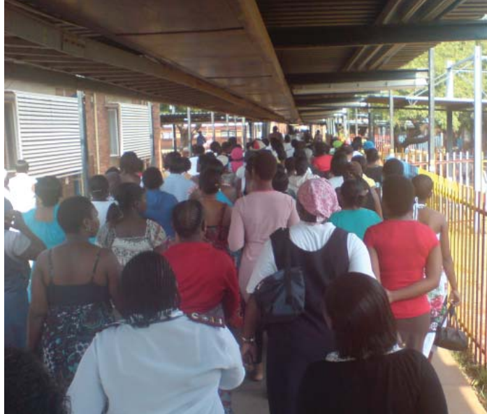
Over: Pregnancy week of course! Både ansatte og pasienter gikk i tog og sang av full hals.

Uka etter var vi fordelt på to forskjellige klinikker.